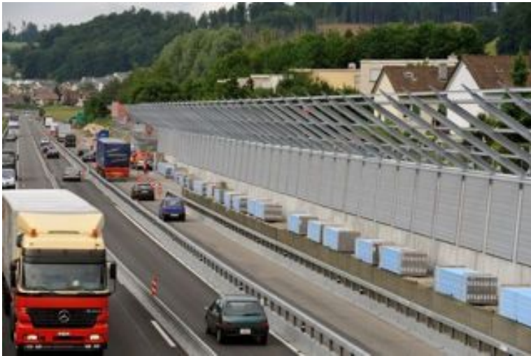
L'OFEV préconise les véhicules, les pneus et les revêtements silencieux pour diminuer le bruit.