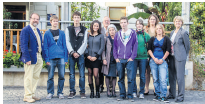
Les nouveaux citoyens et les membres de la Municipalité. Malloth

18 ans, c'est l'âge du permis de voiture, de la majorité, et aussi celui du droit de vote. La commune de Bussigny a, comme chaque année, lancé une invitation à tous les jeunes ayant passé ce cap important dans l'année. Le programme proposé: un apéritif, un repas en compagnie de plusieurs municipaux, et, pour la première fois, la possibilité d'assister à une séance du Conseil communal.